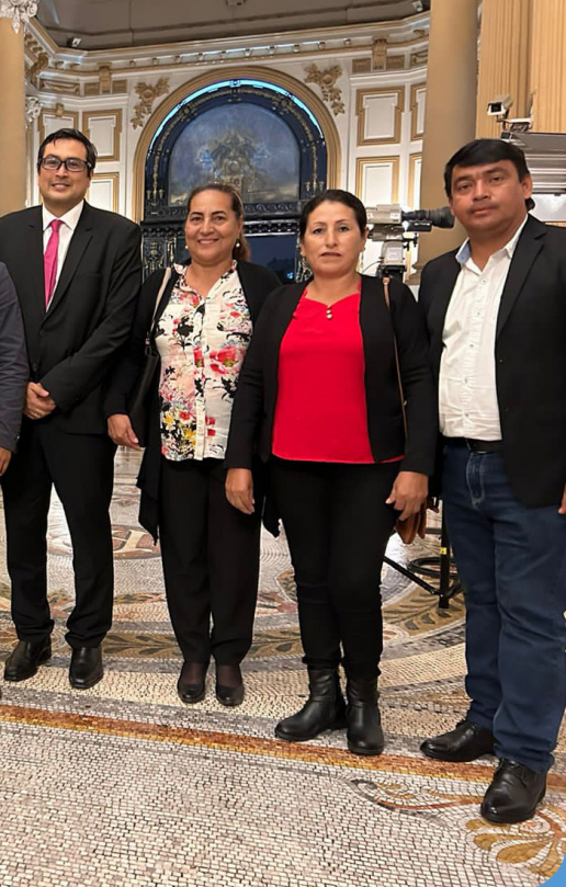
El presidente de la Comisión de Economía del Congreso, César Revilla; y el alcalde de Puinahua, Giordano Mendoza, junto a sus colegas de Requena, impulsaron la nueva ley del canon en el Parlamento.