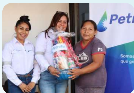
En representación de Sifora Hidalgo