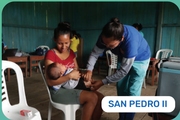
SAN PEDRO II