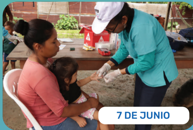
7 DE JUNIO