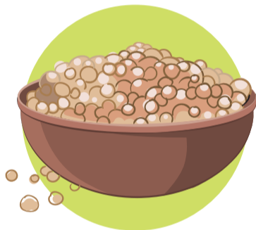
Cereales como la avena, el maíz y la harina de plátano