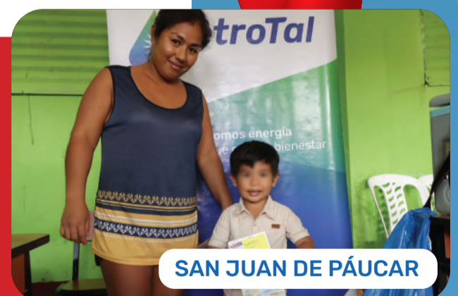
SAN JUAN DE PÁUCAR