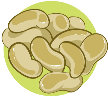
Legumbres como el frijol Chiclayo

¿Cómo prevenir la anemia en nuestros hijos?